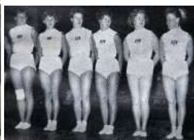
Musterriege der Turner des MTV München, 1. Preis beim Italienischen Bundesturnfest in Florenz 1904; Turner 1905; Musterriege der Turner, 1. Preis beim Eidgenössischen Turnfest in Bern 1906; Siegerinnen 1909, Vorturnerinnen 1921, Turnerinnen 1957.