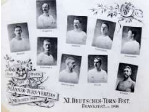
Friedrich Jahn 1778-1852, Deutsche Turnkunst 1816, Turnriege des MTV München im Jahr 1890, Riegenturnen 1909, Turnfestsieger 1908.